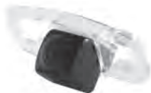
Gazer CC100-XXX Видеокамера Gazer