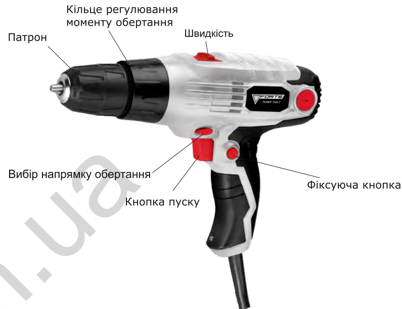
Детальна схема моделі

Рівень швидкості обертання встановлюється перемикачем угорі корпусу шурупокрута.