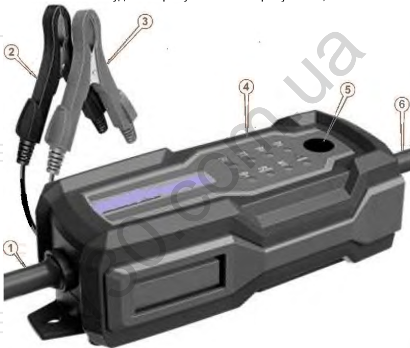
Рисунок 1. Основні елементи будови виробу

Основні елементи будови виробу показані на рисунках 1, 2.