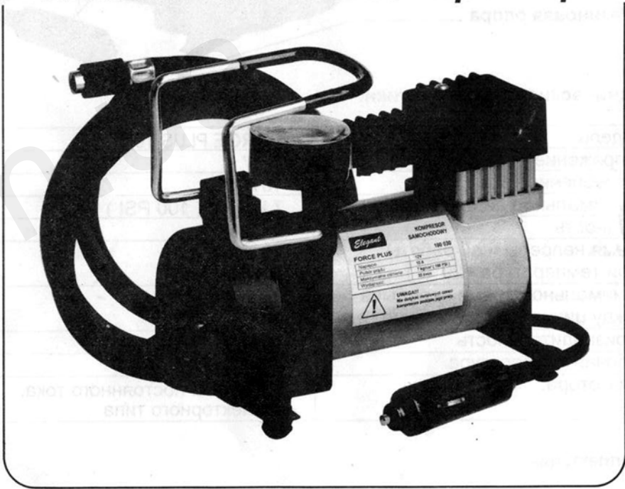
Руководство по эксплуатации