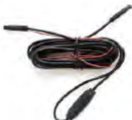
Удлинитель выносной камеры