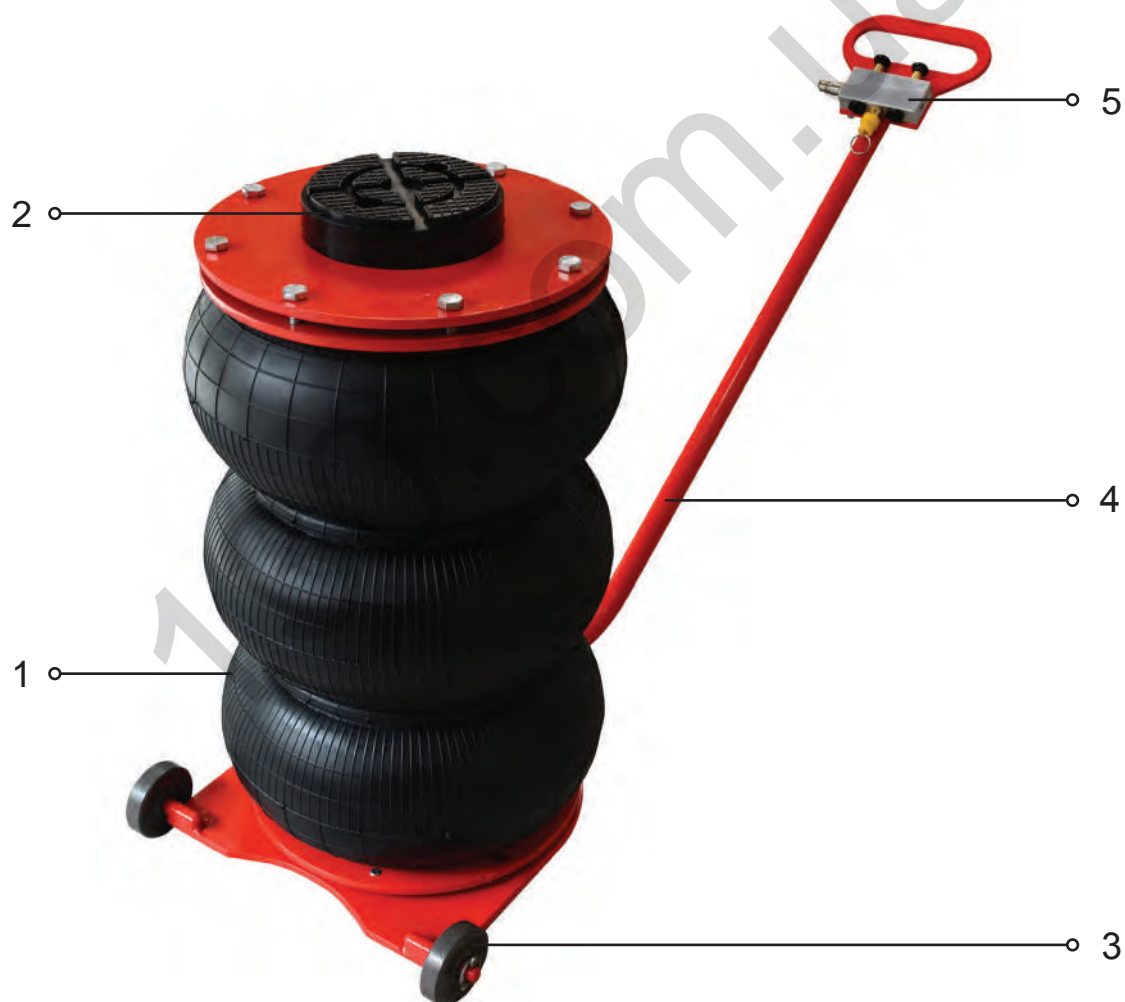
Рисунок 1 – Внешний вид домкрата