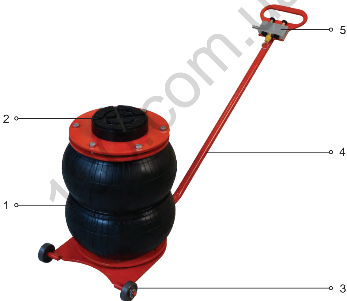
Рисунок 1 – Внешний вид домкрата