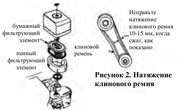
Рисунок 1. Воздушный фильтр