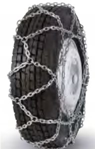
pewag austro super reinforced