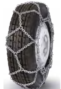
pewag austro super