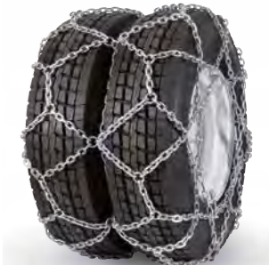
pewag austro super reinforced twin