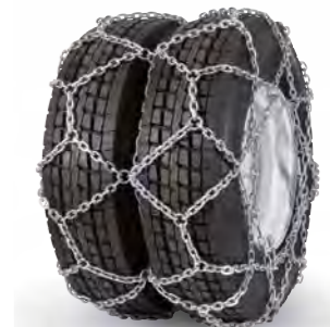
pewag austro super reinforced twin