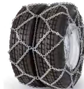
pewag austro super twin