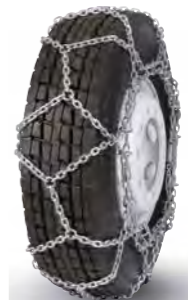
pewag austro super