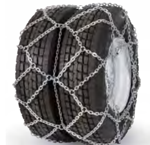
pewag austro super twin