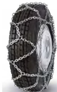
pewag austro super reinforced