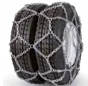
pewag austro super reinforced twin